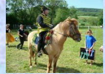
Freestyle Dressur Kostüm & Musik