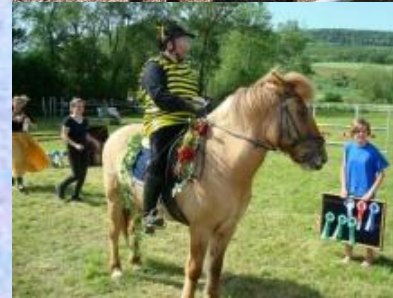
Freestyle Dressur Kostüm & Musik